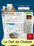
La Daf de Chabat

Vous appréciez «La Daf de Chabat» et désirez faire partie des abonnés ou participer à son édition, veuillez prendre contact dafchabat@gmail.com