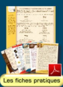
Les fiches pratiques